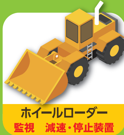
ホイールローダー 監視 減速・停止装置