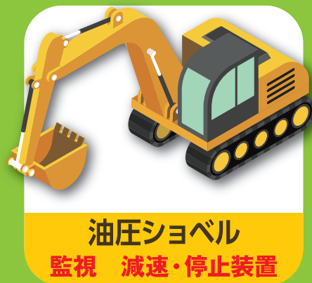
油圧ショベル 監視 減速・停止装置