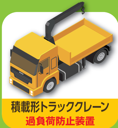
積載形トラッククレーン 過負荷防止装置

所定の建設機械に厚労省指定の安全装置を取り付けることで補助を受けられる制度です！